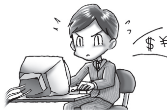
たぶんあなたは仕事の鬼