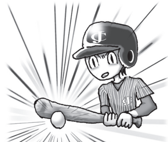
たぶんあなたはスポーツ万能