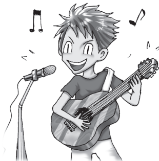
たぶんあなたは 天才アーティスト